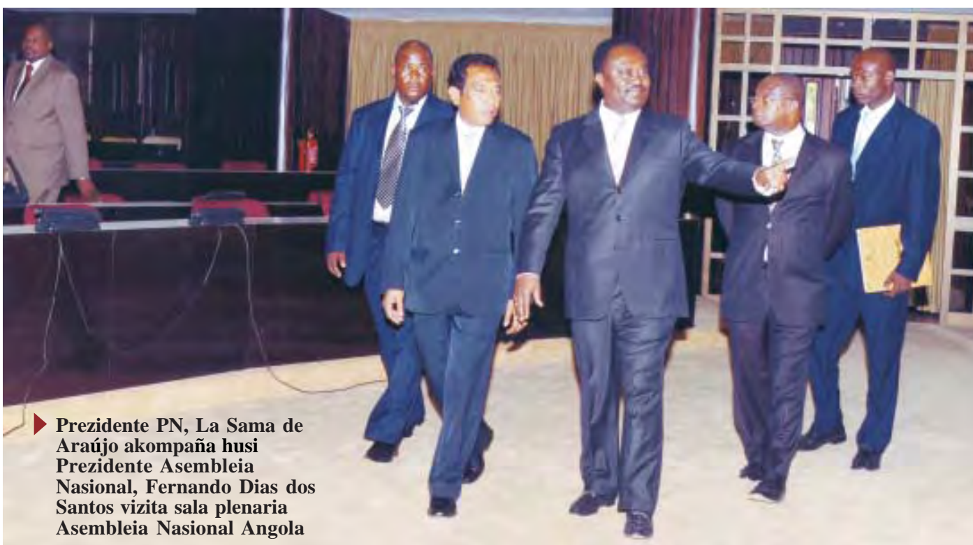
► Presidente PN, La Sama de Araújo akompania husi Presidente Asembleia Nasional, Fernando Dias dos Santos vizita sala plenaria Asembleia Nasional Angola

É nosso entendimento de um partido na Oposição consideramos que em democracia, sejam quais forem os resultados das eleições, não há vencedores nem perdedores absolutos ; em democracia o poder é sempre transitório.